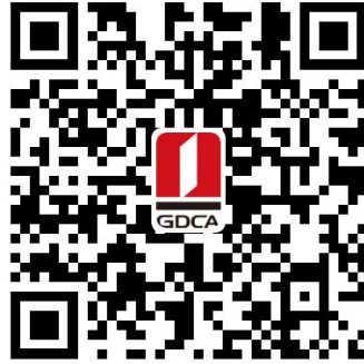
抚州市住房公积金管理中心 数字证书业务申请二维码