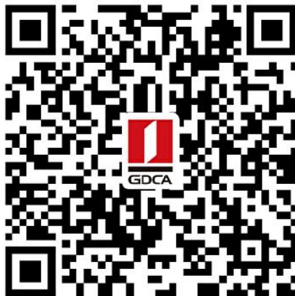
惠州市公共资源交易中心 数字证书业务申请二维码