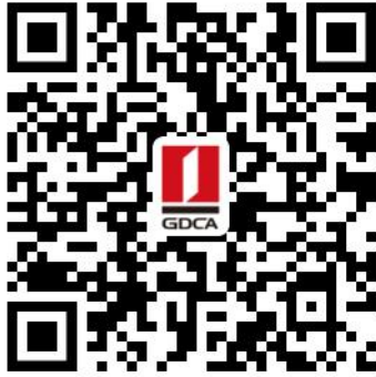
梅州市住房公积金 数字证书业务申请二维码